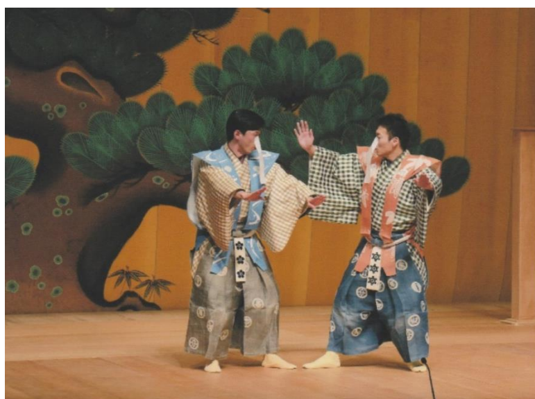
上から 能「羽衣」、能「土蜘蛛」、狂言「膏薬煉」